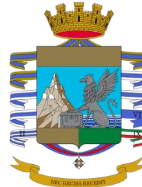
Guardia di Finanza